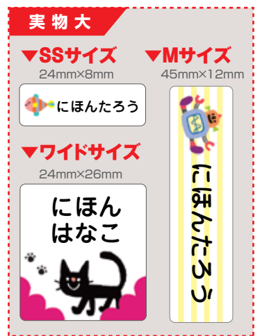
イラスト: たはらともみ tomomi tahara http://majollyna-majollyne.com/